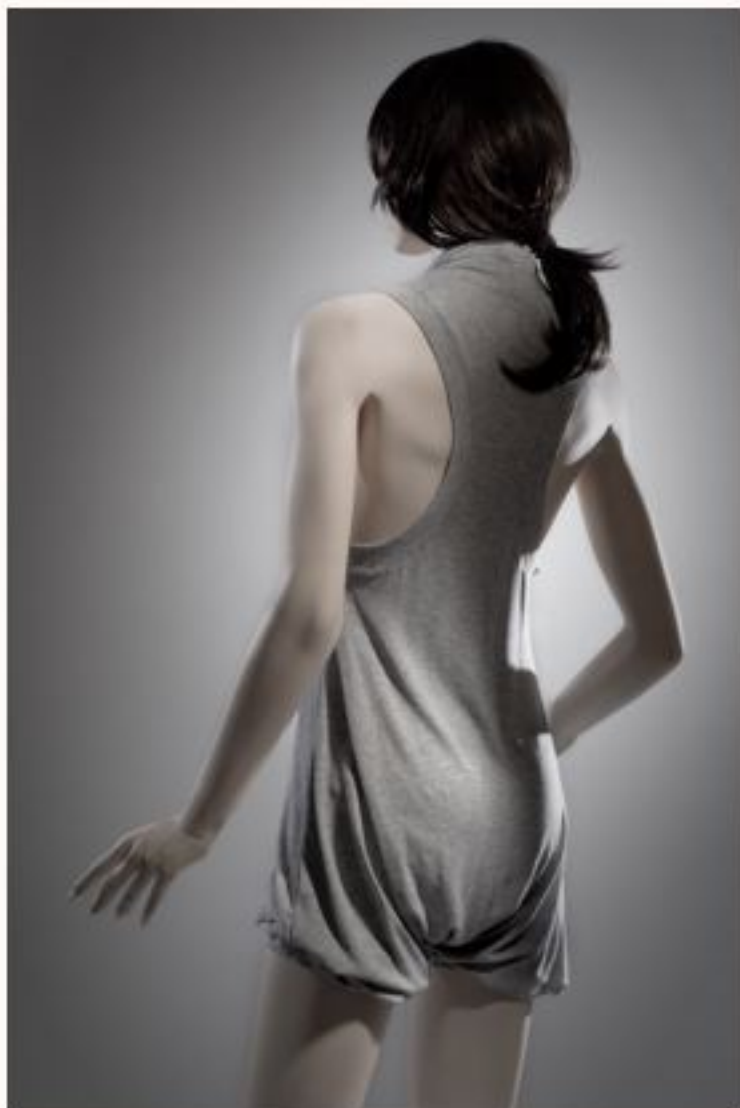
Strickoverall SIMONE AW1011-064