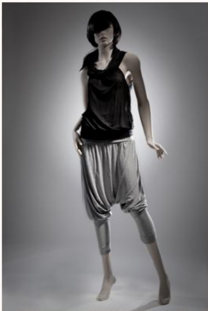
Rollkragentop LUCIE AW1011-029 Pumphose MYLENE AW1011-057