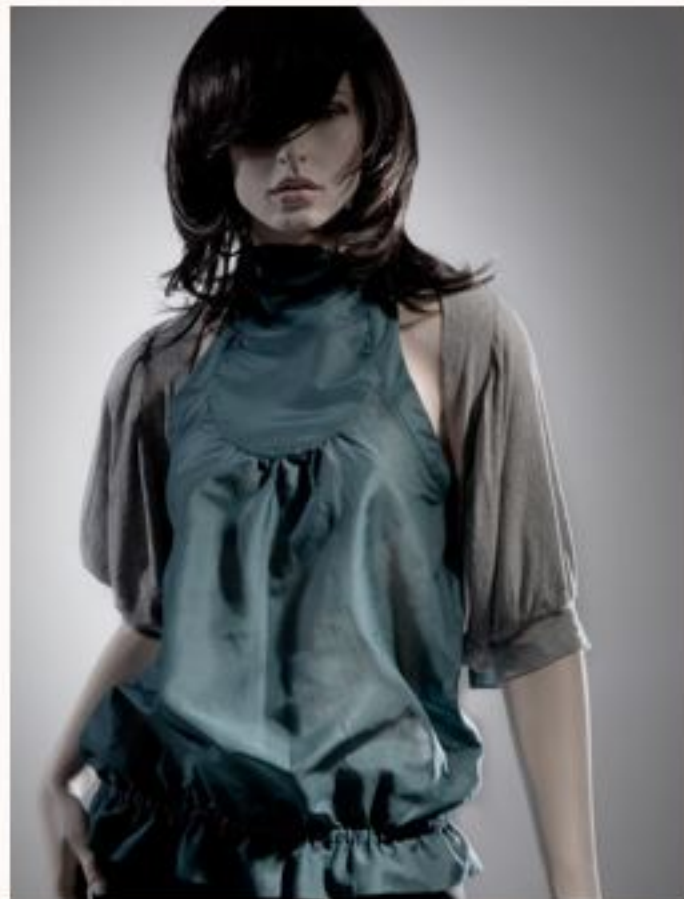
Seidenneckholder BIBIE AW1011-046 Strickbolero LARA AW1011-062 Röhre ROSE AW1011-061