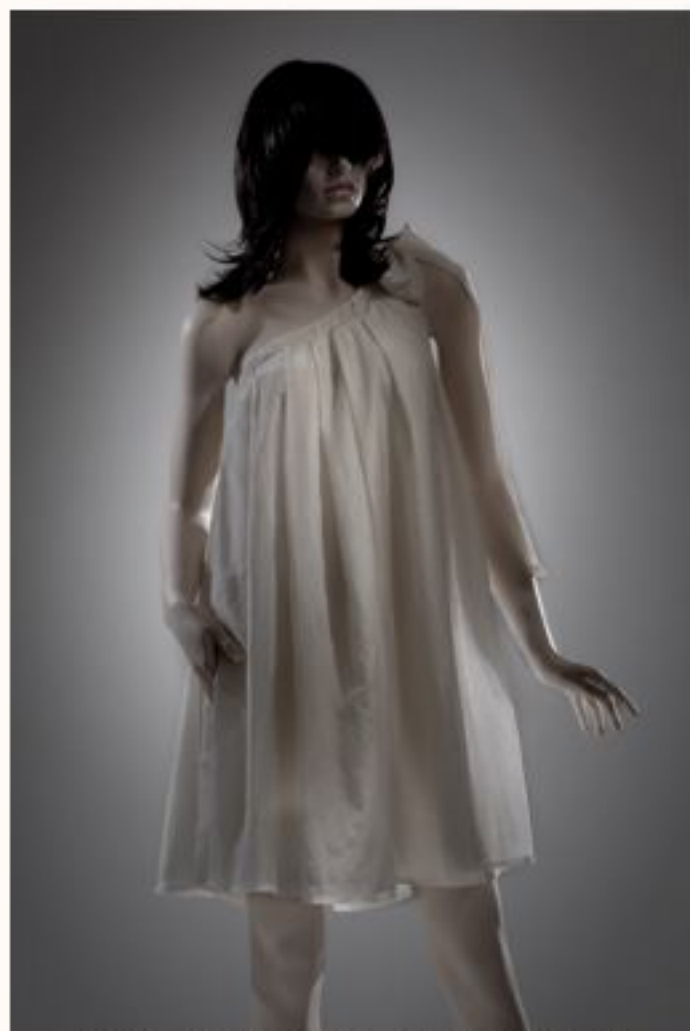
Seidenkleid ELENA AW1011-053