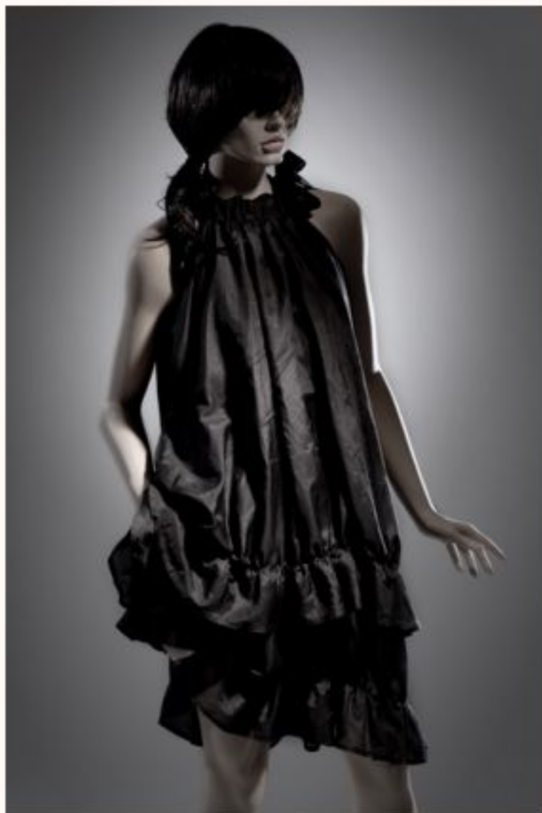
Seidenkleid EMMANUELLE AW1011-047