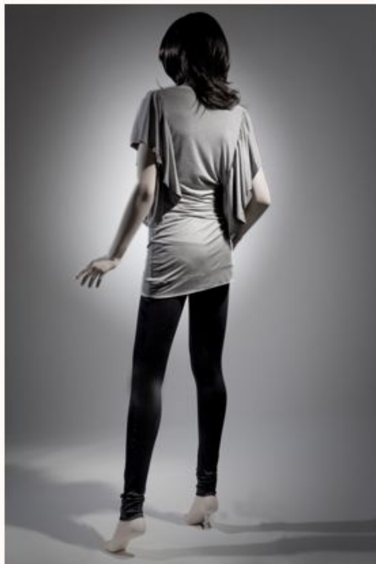
Longtop JULIETTE AW1011-050 Leggings ANETTA AW1011-059