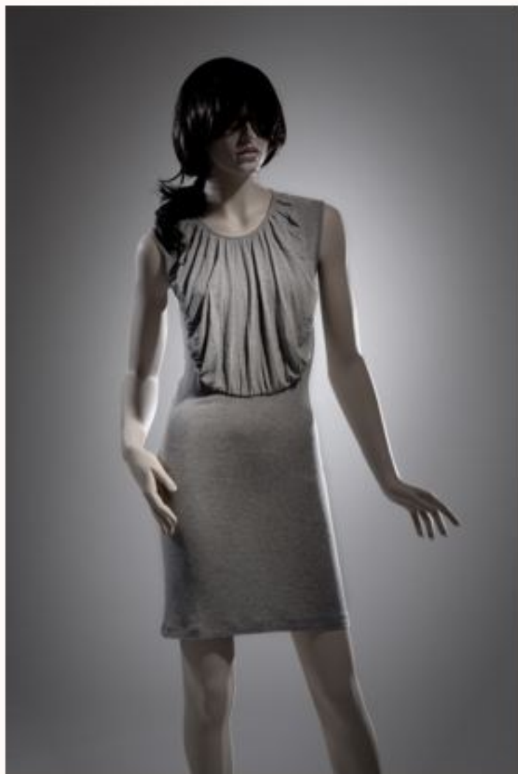
Strickkleid CHARLOTTE AW1011-051