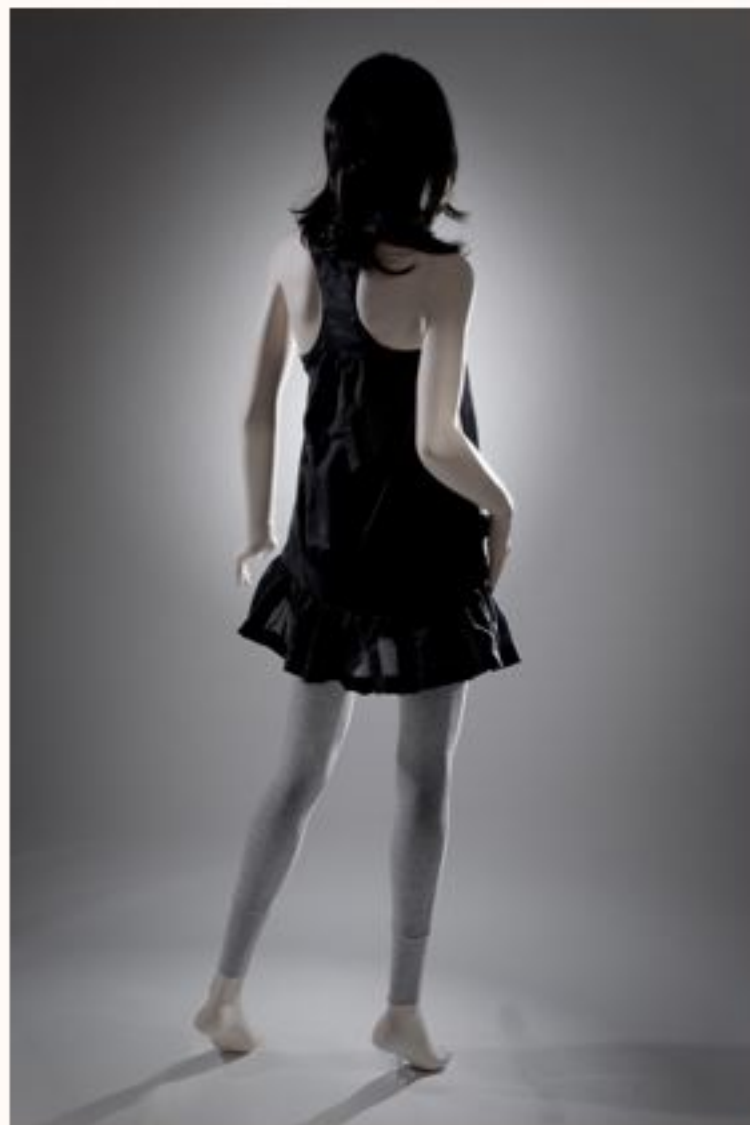
Seidentankkleid LILLE AW1011-052 Leggings ANETTA AW1011-059