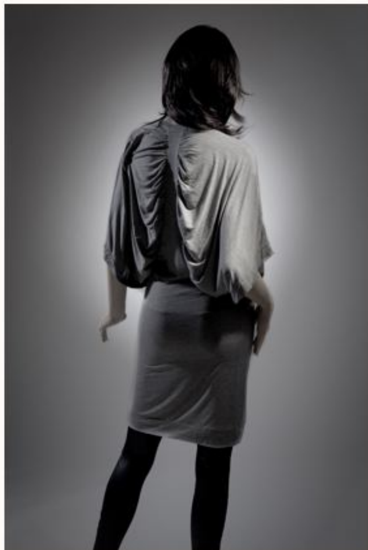
Jerseykleid GRACE AW1011-049