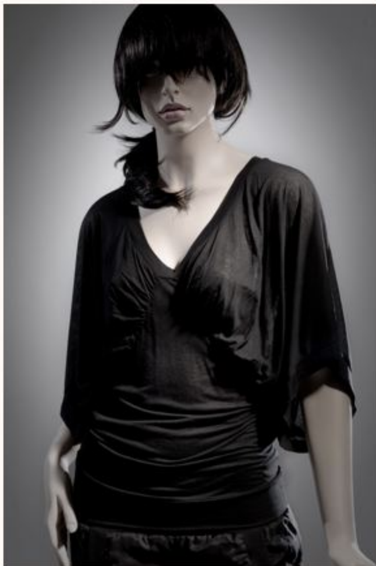
Jerseytop MARIT AW1011-030 Seidenhose ANA AW1011-058