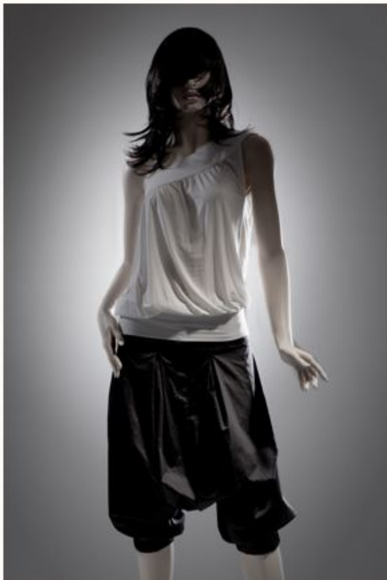
Jerseytop EDITH AW1011-032 Pumphose ARMELLE AW1011-057